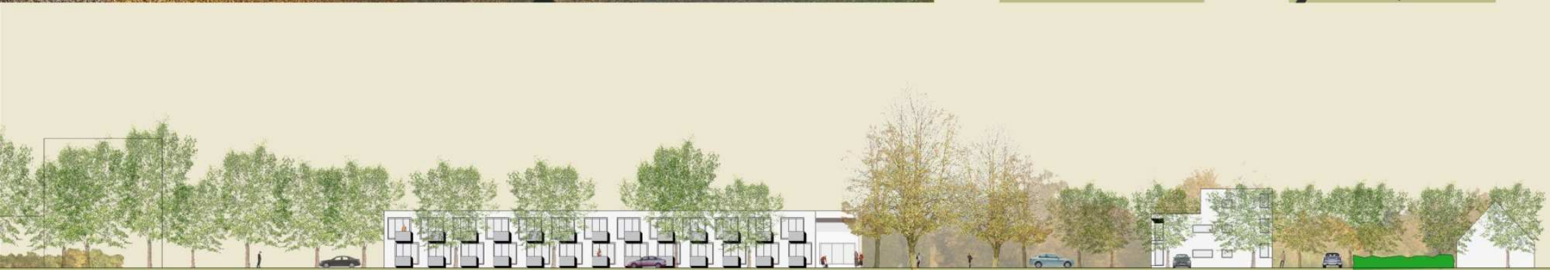
Verwaltung Pflegeheim Wahrkamp Park Mehrfamilienhaus nördliche Wohnstrasse Einfamilienhaus