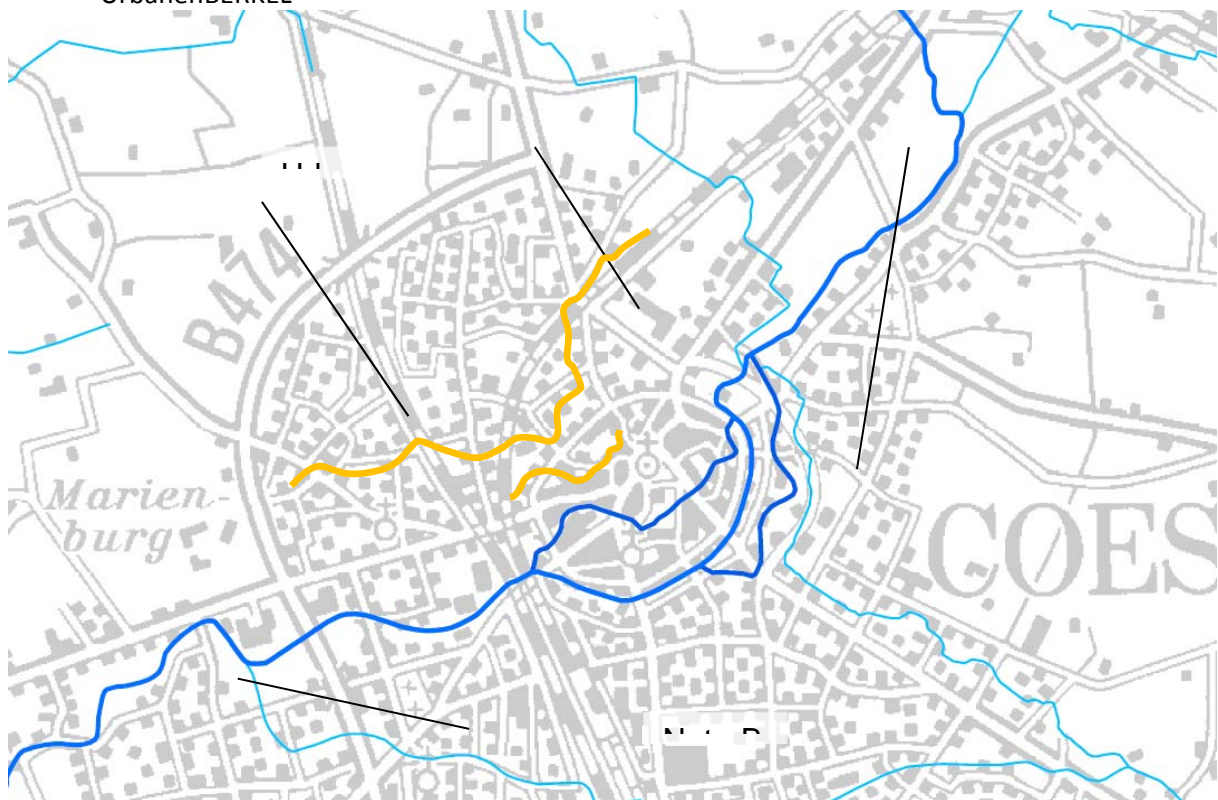
Abbildung 1.-4: NaturBERKEL und UrbaneBERKEL

Die NaturBERKEL ist die grundlegende Voraussetzung für die UrbaneBERKEL in Coesfeld, da so keine wasserwirtschaftlichen und ökologischen Anforderungen an die UrbaneBERKEL gestellt werden.