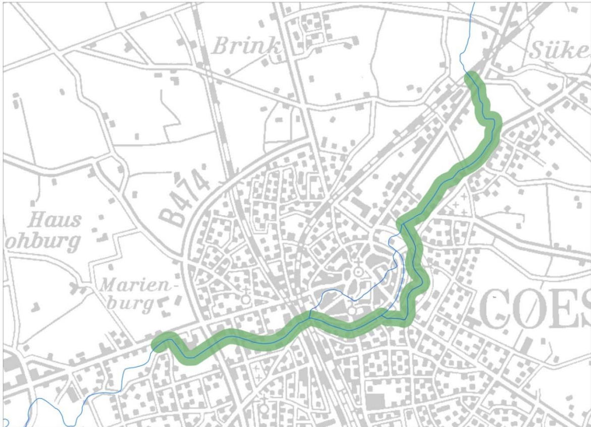
Abbildung 1.-2: Ökologischer Wanderkorridor - NaturBERKEL

Diese Aussagen beruhen auf der Überlegung und der planerischen Aufteilung der Funktionen des Gewässers. Die visuelle Grundlage hierfür stellen die unten stehenden Funktionsskizzen dar. In grün ist der ökologische Wanderkorridor – die NaturBERKEL - dargestellt. Dieser erfüllt die Anforderungen der EG WRRL für aquatische und semiaquatische wandernde Tierarten.